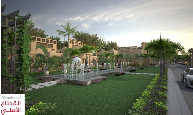
أحد مشروعات القطاع الأهلي